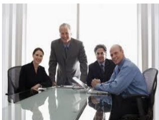
Directores y Gerentes