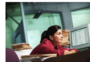
Analistas de Marketing