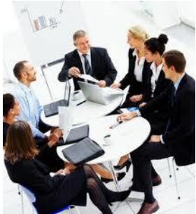
Analistas de Post Venta