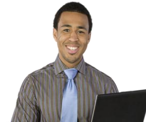
Fuerza de Ventas